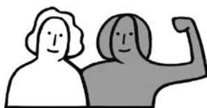
Frauen-Beauftragte in Einrichtungen

„Es ist wichtig für Frauen, dass sie gefragt werden, was sie wollen. Dafür brauchen sie eine Ansprechpartnerin. Darum muss es in Wohnheimen und Werkstätten